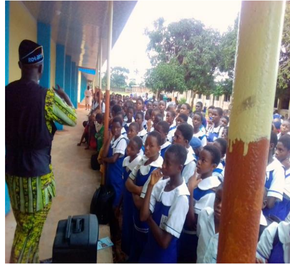
La instrucción sanitaria.

La labor de La Fundación Rotaria enaltece el trabajo de los rotarios porque su aporte solidario en obras de bien se extiende por todo el mundo. Y, el compromiso individual de esos rotarios y las comunidades a las que pertenecen, marcan la diferencia en la sociedad