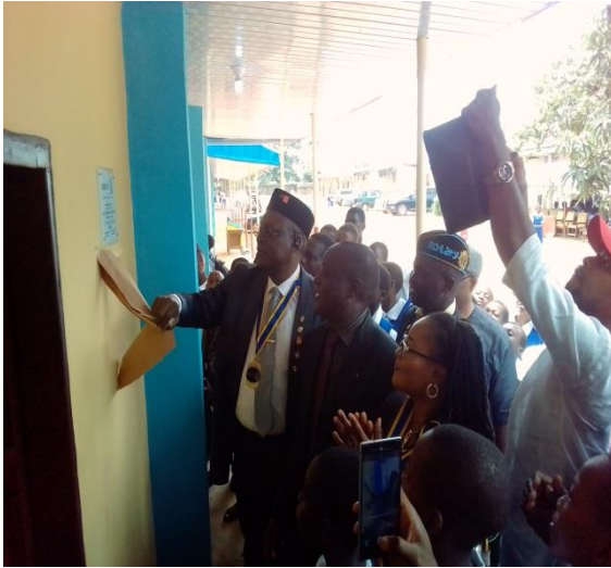
La inauguración oficial.

Y el resultado final de la solidaridad entre pueblos distantes geográficamente pero unidos por Rotary: