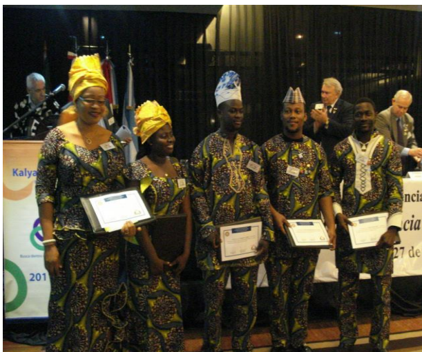
El grupo de IGE Nigeria en la Conferencia de Distrito 4835, período 2011/2012

A continuación, algunas imágenes de este largo proceso: