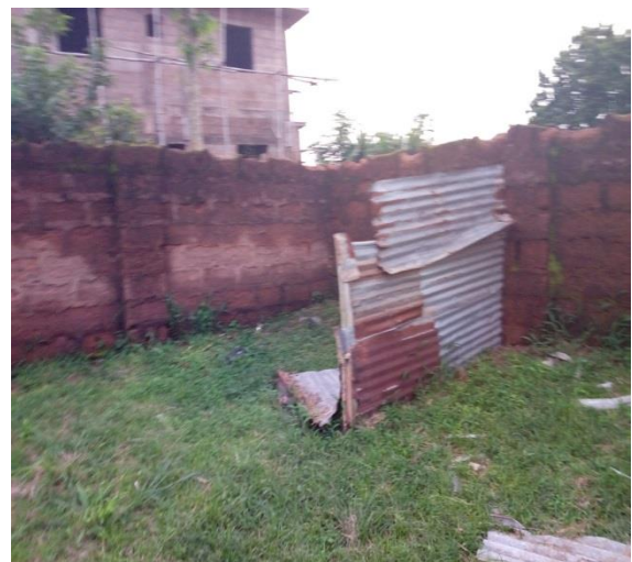
La realidad inicial en Ekpoma, Nigeria.